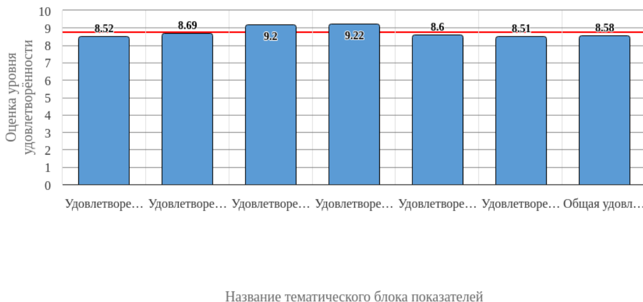
Рисунок 3.1 - Средняя оценка удовлетворенности (по всем тематическим блокам показателей)

Средняя оценка удовлетворенности респондентов по блоку вопросов «Удовлетворенность организацией обучения» равна 8.52, что является показателем высокого уровня удовлетворенности (75-100%).